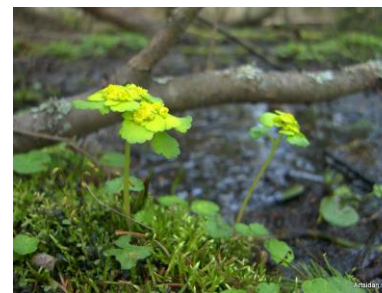
Gullpudra, en av signalarterna