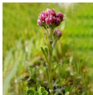
Kattfot, en av arterna vi kan se vid Ängsholmen.